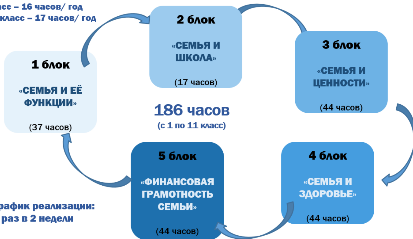
График реализации: 1 раз в 2 недели

1 класс – 16 часов/ год 2-11 класс – 17 часов/ год